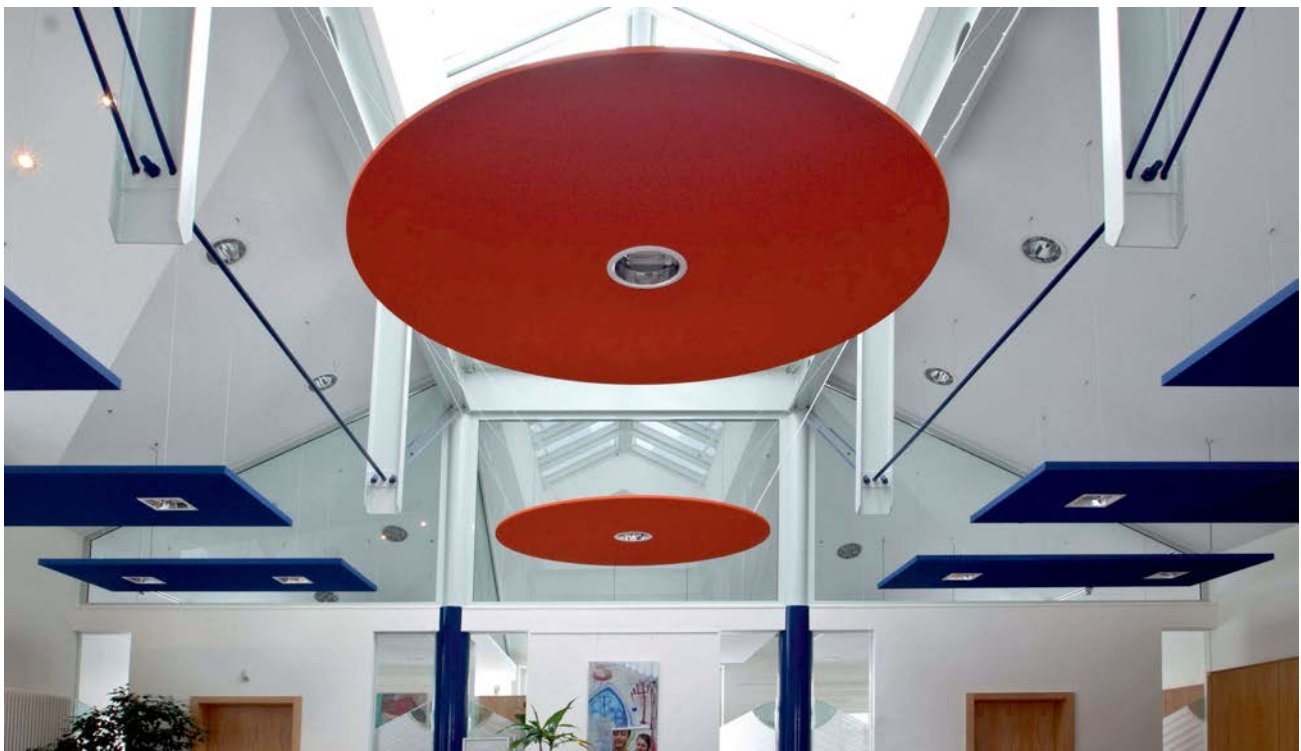
BER Solith-G Akustik-Deckensegel, kreisrund im Sonderfarbton

Aus einer partnerschaftlichen Zusammenarbeit mit Architekten, Planern, Akustikern und ausführenden Handwerksbetrieben schöpft BER wertvolle Anregungen, wie sie Leistungsmerkmale der Akustiksysteme verbessert und neue technische Lösungen gefunden werden können. Überzeugende Resultate kostengünstig zu erreichen, das steht im Vordergrund.