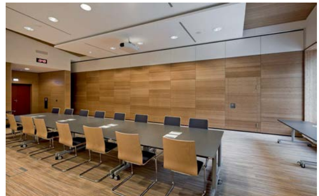
Konferenzräume / Sitzungsräume